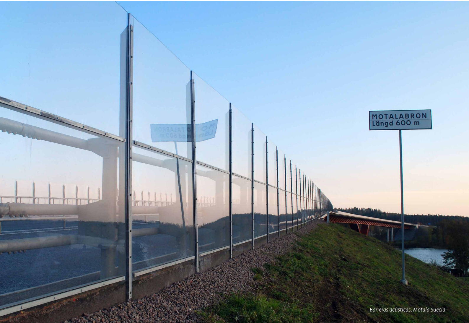
Barreras acústicas, Motala Suecia.